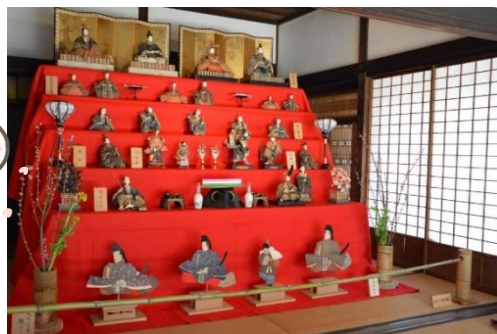
(次大夫堀公園民家園のおひなさま)