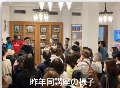
昨年同講座の様子