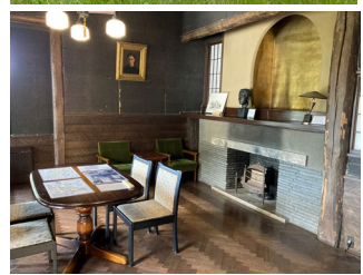
In the case of rain, the tea ceremony will be held in the tea room. Please bring clean white socks as it is customary.

Application Available March 26th 10 a.m. Please apply through the web site.